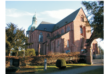
Die Stiftskirche in Amöneburg