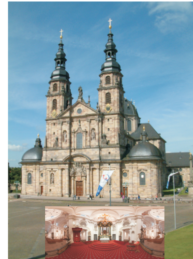
Der Hohe Dom zu Fulda