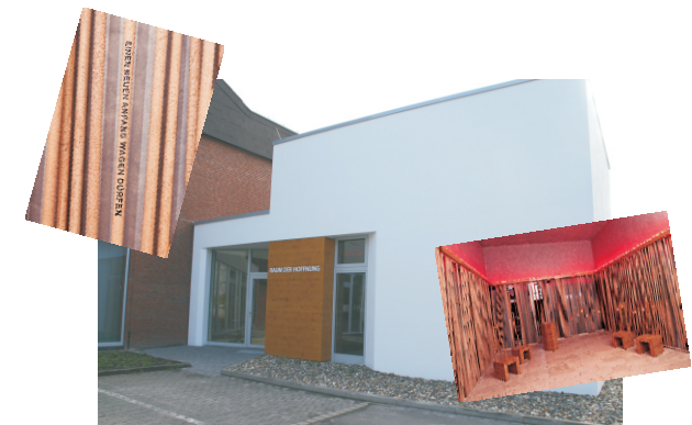
Der "Raum der Hoffnung" in Vellmar