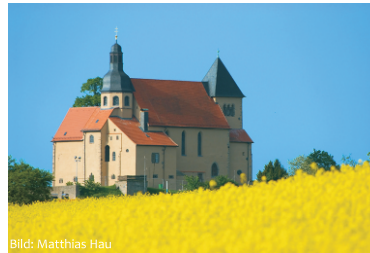
Die Liobakirche in Petersberg