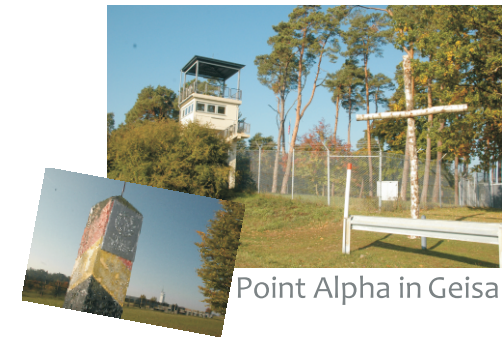
Point Alpha in Geisa