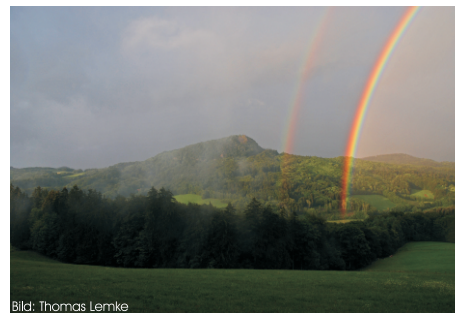
Die Milseburg in der Rhön