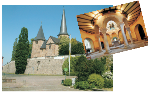
Die Michaelskirche in Fulda