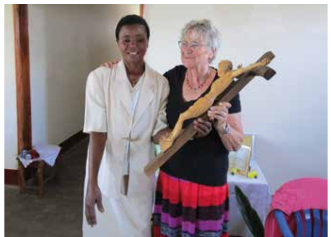
Das Kreuz, ein Geschenk zur Einweihung des Gemeindehauses in Mpeefu

Wer die Arbeit unterstützen möchte: Katholische Kirchengemeinde St. Simplicius Iban: DE28 5305 01800000 0618 81 Verwendungszweck MAKADI Projekte Parament