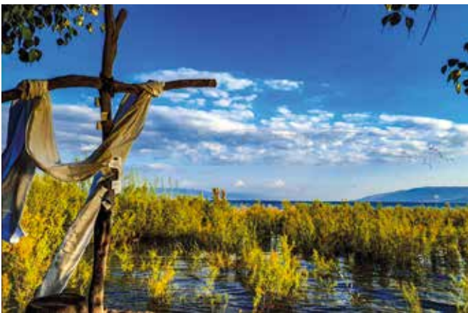
P. Basilius; Ostern 2020 am randvollen See mit unserem Osterkreuz.

Christen sind der Überzeugung: „ Unsere Heimat ist im Himmel “. Jerusalem ist für uns die Stadt, die an den Tod und die Auferstehung Jesu bleibend erinnert. Jesu Botschaft aber weist über diese sichtbare Erde und Jerusalem hinaus.