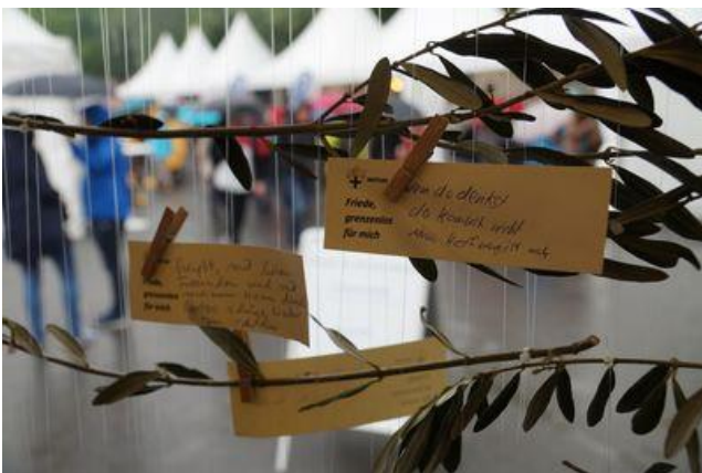
„Grenzzaun“ aus Olivenzweigen