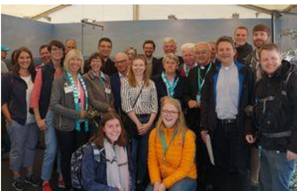
Besucher am Bistumsstand