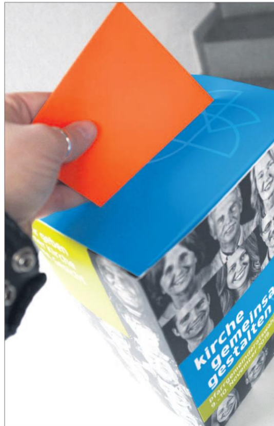
» „Kirche gemeinsam gestalten“ – darum waren Katholiken zur Wahl gerufen.

In einigen Dekanaten liegt der Anteil der Frauen noch höher. So sind in den Dekanaten Marburg – Amöneburg und Hünfeld – Geisa etwa dreimal so viele Frauen in den Pfarrgemeinderäten vertreten wie Männer. In manchen