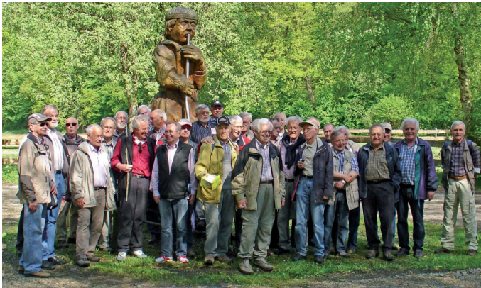
Wanderung im Gläserntal/Niese