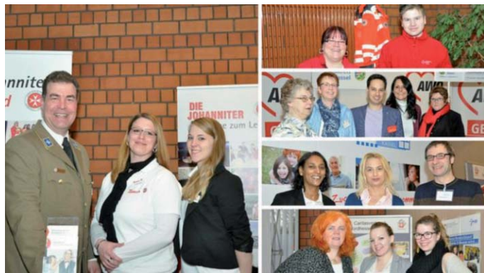
Benefizaktion für die Flüchtlingshilfe XSTIMMEN KÜCHE BAD