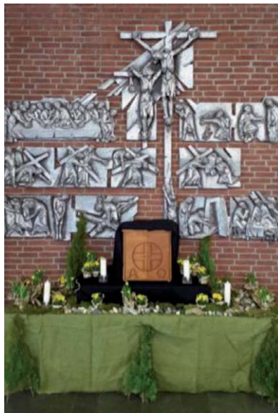
Das Heilige Grab am Gründonnerstag