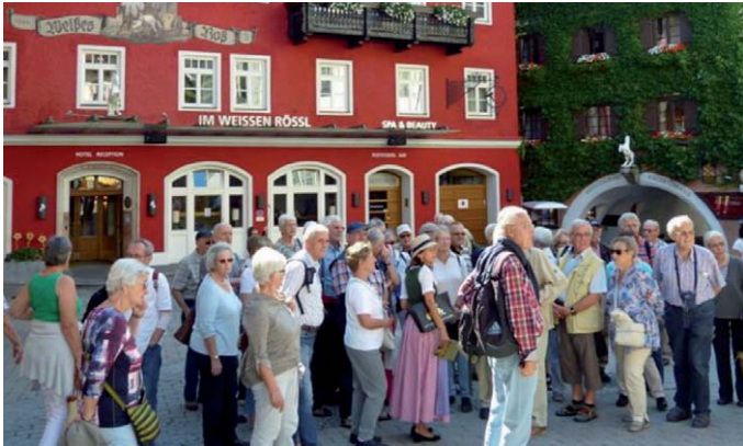
Ausflug nach St. Wolfgang