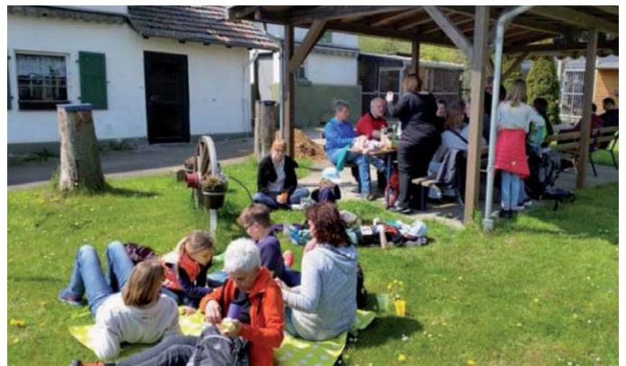
Picknick bei der Wanderung am 1. Mai