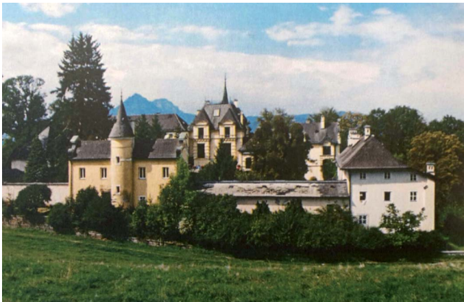
Die Unterkunft – das Johannes Schlöbl