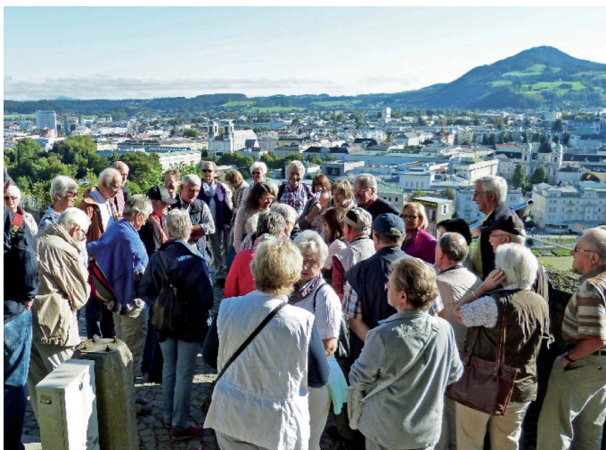
Gruppenbild mit Blick auf Salzburg