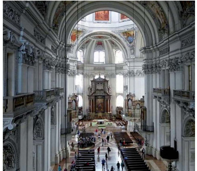
Blick von der Orgelempore in den Salzburger Dom