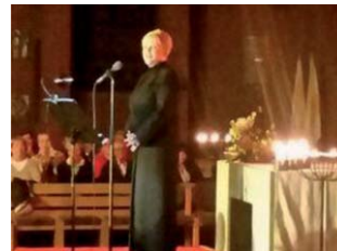
Angelika Milster Konzert