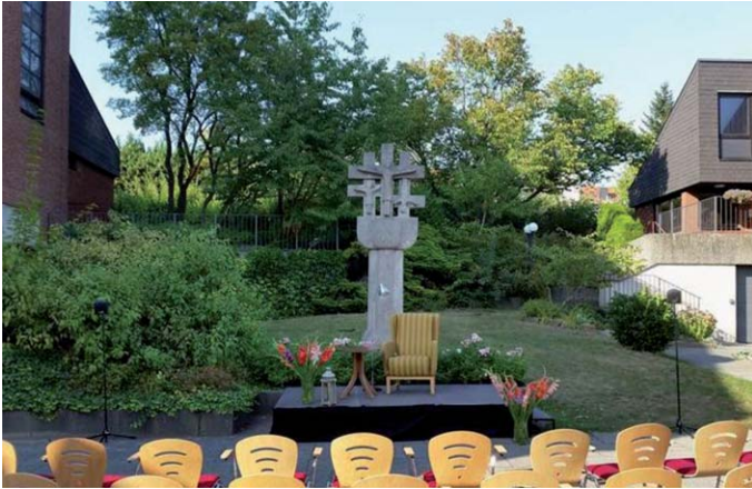
Literatur auf dem Kirchplatz