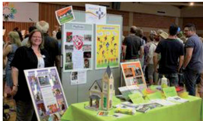
Messestand der Heilig Geist Pfarrei bei der Bildungsmesse