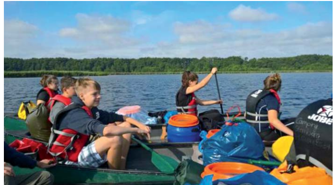
Kanutour der Jugendlichen auf der Warnow