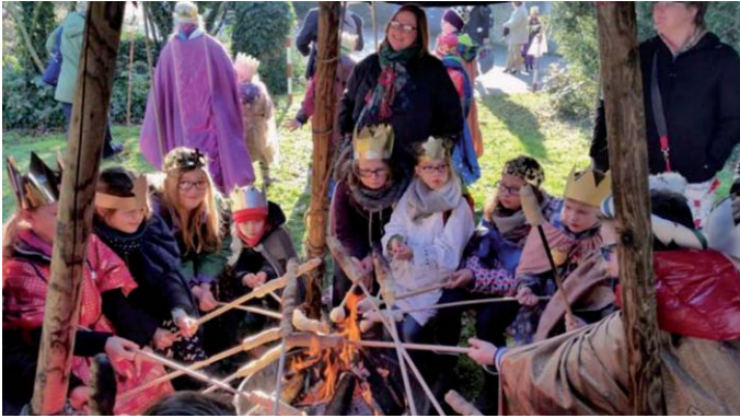
Bundesweite Aussendung der Sternsinger in Fulda