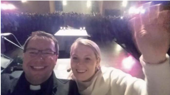
Selfie mit Patricia Kelly