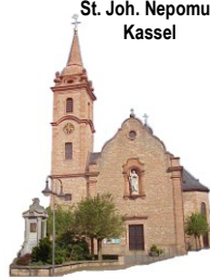
St. Joh. Nepomuk Kassel

12. Jahreskreiswoche 19.06. –27.06. 2021