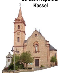
St. Joh. Nepomuk Kassel

15. + 16. Jahreswoche 11.07. bis 26.07.2020