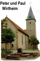
St. Peter und Paul Wirtheim